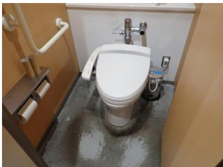
本来の床の色でしょうか？